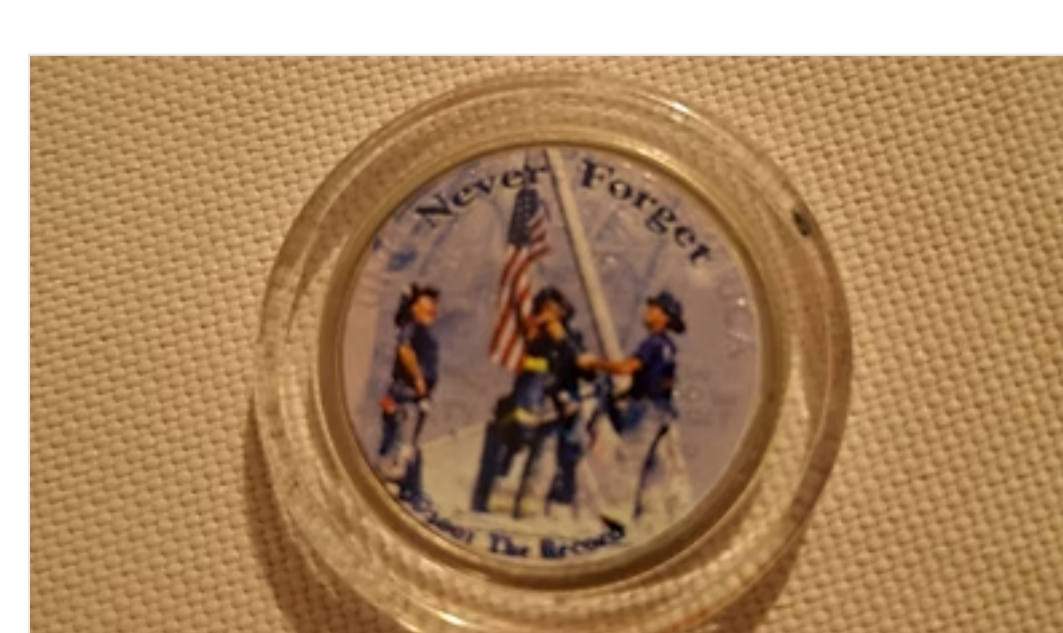
Leserpost: Überdruckter "New York State Quarter"