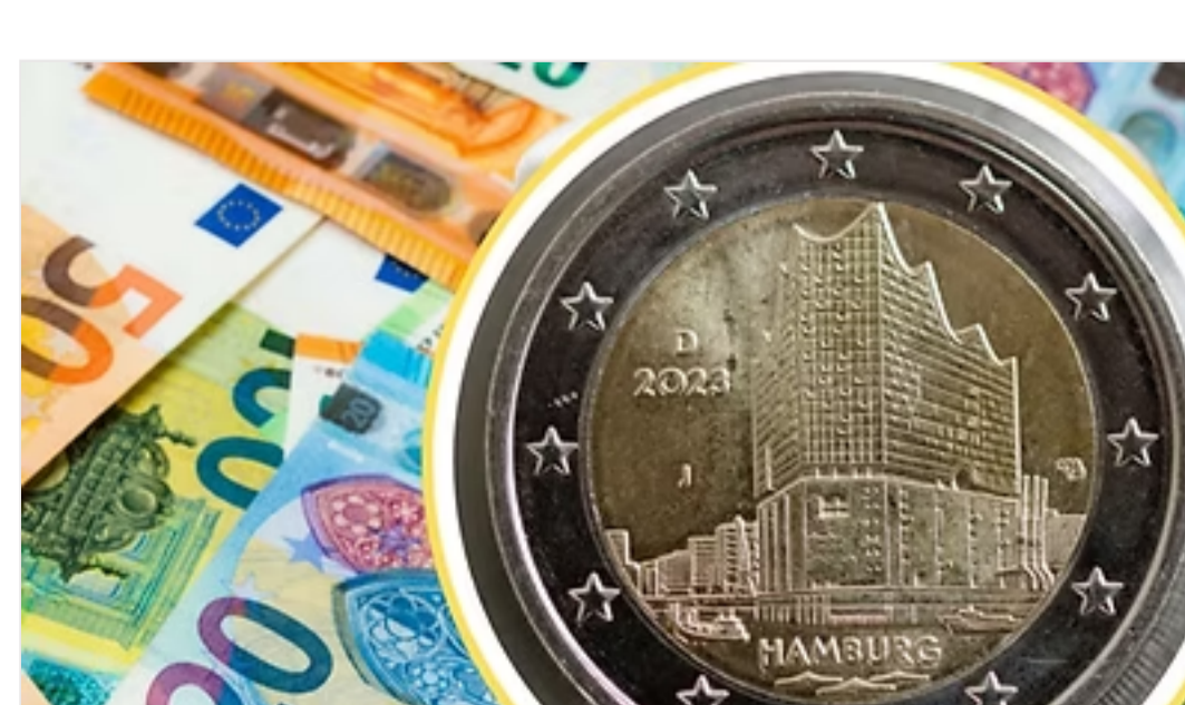
Leserpost: „Fehlprägung“ aus dem Portemonnaie