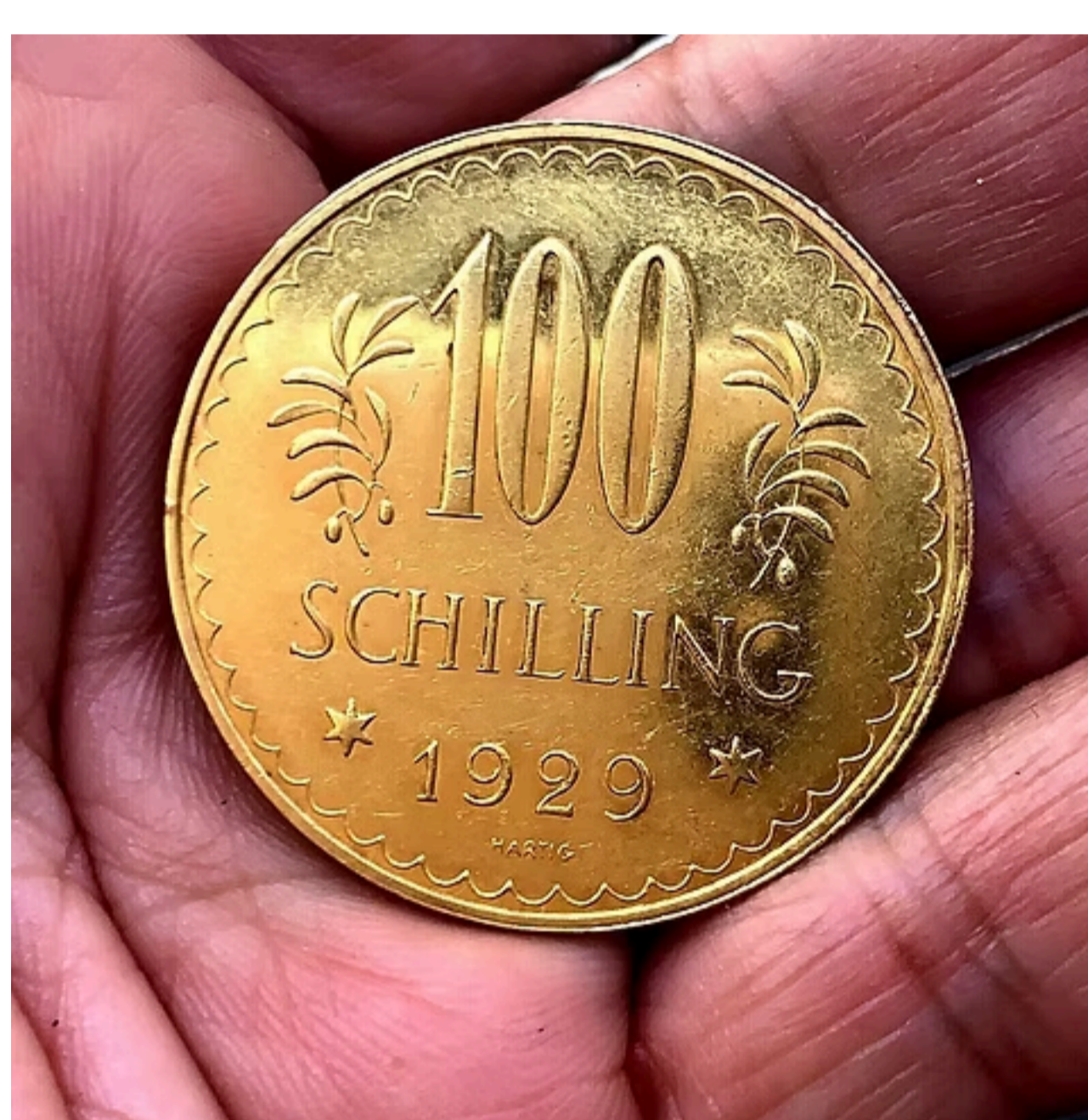
100 Schilling (Österreich, 1929, 900er Gold, 23,5 Gramm, 33 mm)