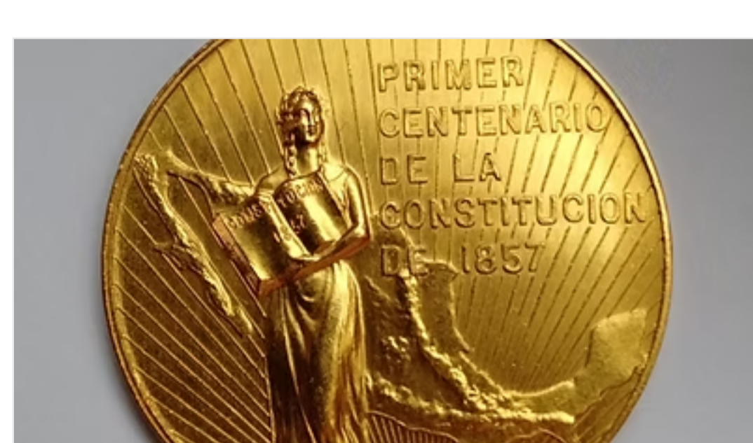
Leserpost: Wert einer Goldmedaille