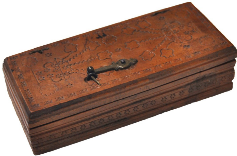
Abb. 5: Lade zum Satz Probiengewicht von Johann Kirch 1753.

Die Lade aus Ahorn-Holz hat die Abmessungen: Breite 147 mm; Tiefe 64 mm und Höhe 37 mm. Im Kölnischen Stadtmuseum sind noch zwei weitere Gewichtssätze von Johann Kirch aus dem Jahr 1765 vorhanden. 14