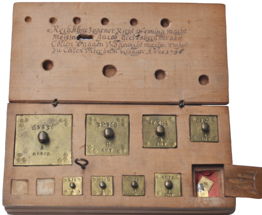
Abb. 6: Mark-Gewichte von Jakob Grevenberg 1765. 16