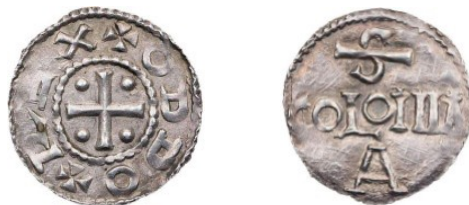
Abb. 1: Kölner Pfennig, Otto III., 983–1002, 1,52 g, 19 mm, Hävernick 67.