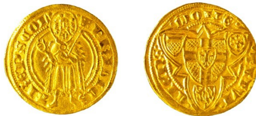
Abb. 2: Erzbistum Köln, Friedrich III. v. Saarwerden, 1371–1414, Gulden (1386), Deutz, 3,515 g, 22 mm, Noss 211a, Sammlung Kölnisches Stadtmuseum.

Bereits am 8. Juni 1386 gab es Änderungen. 8 Bei den Gulden wurde noch zusätzlich eine Abweichung nach unten erlaubt. „ Und man sal geben umb eine Marck fins Goldes, der vorgeschrieben Guldin sieben unde seßig und nit mee. “ Das ergibt 67 auf eine Mark (3,490 g). 9 Dieser niedrigere Wert wurde bei der Herstellung sicherlich genutzt.