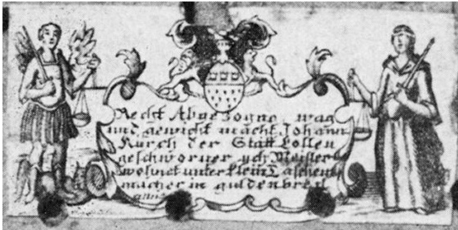
Abb. 4: Etikett zum Satz Probiergewichte von Johann Kirch 1753.

Das Etikett aus Papier mit Bauer und Jungfrau neben dem Kölner Wappen und dem Text „Recht Abgezogene wag und gewicht macht Johann Kurch der Statt Colten geschworener ych Meister wohnt unter klein Taschenmacher in gulden brezl anno ...“ ähnelt denen, die bei den Münzwaagen verwendet wurden.